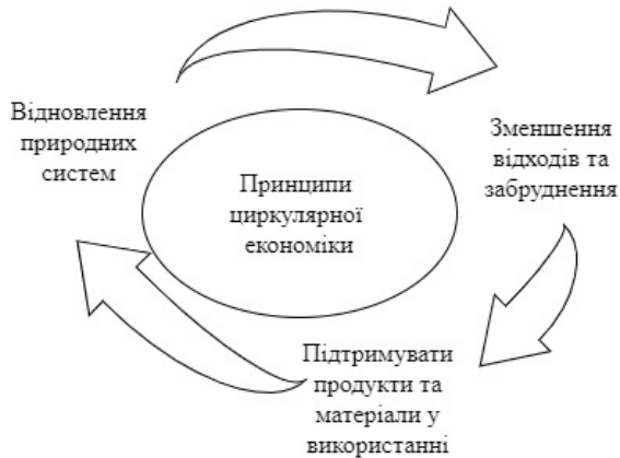
Рисунок 3 – Принципи циркулярної економіки

стійке ресурсокористування; стимулювання інновацій; можливість задовольнити потреби населення; зростання економіки та доходів; збільшення рівня переробки та повторного використання може створити додатково 1 трлн доларів США для глобальної економіки до 2025 р.