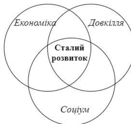
Рисунок 2 – Складові «сталого розвитку»

замкненого циклу виробництва (планування потреби виробництва у матеріалах) та переробки у виробництві, що дає змогу забезпечити захист навколишнього середовища та знижує первинну потребу підприємств промисловості у зовнішніх ресурсах [8; 11; 13].