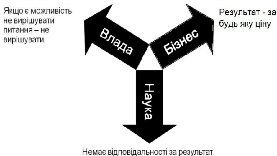
Рис.1.Спрямування взаємодії бізнесу, науки і влади в наукових дослідженнях

2. 2. Стан бізнесу. Сучасний бізнес характеризується боротьбою за виживання. Криза. Податковий тягар. Відсутність державної підтримки. Засилля східних конкурентів. Все це призводить до того, що бізнес турбується найчастіше не про розвиток, а про забезпечення власної життєдіяльності. Це традиційна філософія життя. Спочатку забезпечуємо свою життєдіяльність, а потім будемо розвиватися. Однак в живій природі реалізована зовсім інша концепція. Розвиваючись – забезпечити свою життєдіяльність. Чим більш розвинена особа, тим більш гарантована їй можливість виживання в цьому світі, в суспільстві. Так само і в бізнесі. Більш розвинені компанії мають більше шансів вистояти і в конкурентній боротьбі, і в період кризи. В основі розвитку як людини, так і бізнесу звичайно інформація. Якщо звернути увагу, на що йдуть фінансові ресурси в передових західних країнах і в Україні, то побачимо, що там кошти витрачаються в основному на інформацію, на знання. На другому-третьому місцях енергетичні та матеріальні ресурси. В нашій країні бізнесу здебільшого не до інформації, не до знань, не до науки.