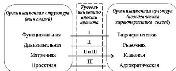
Рис. 2. Закономерности взаимодействия типов организационных структур проекта и организационных культур типологии Р. Камерона и К. Куина

Таким образом, для обеспечения адаптивности проекта на этапе его планирования необходимо согласовать между собой уровень инновационности проекта – тип организационной структуры проекта – тип организационной культуры проекта (рис. 2).