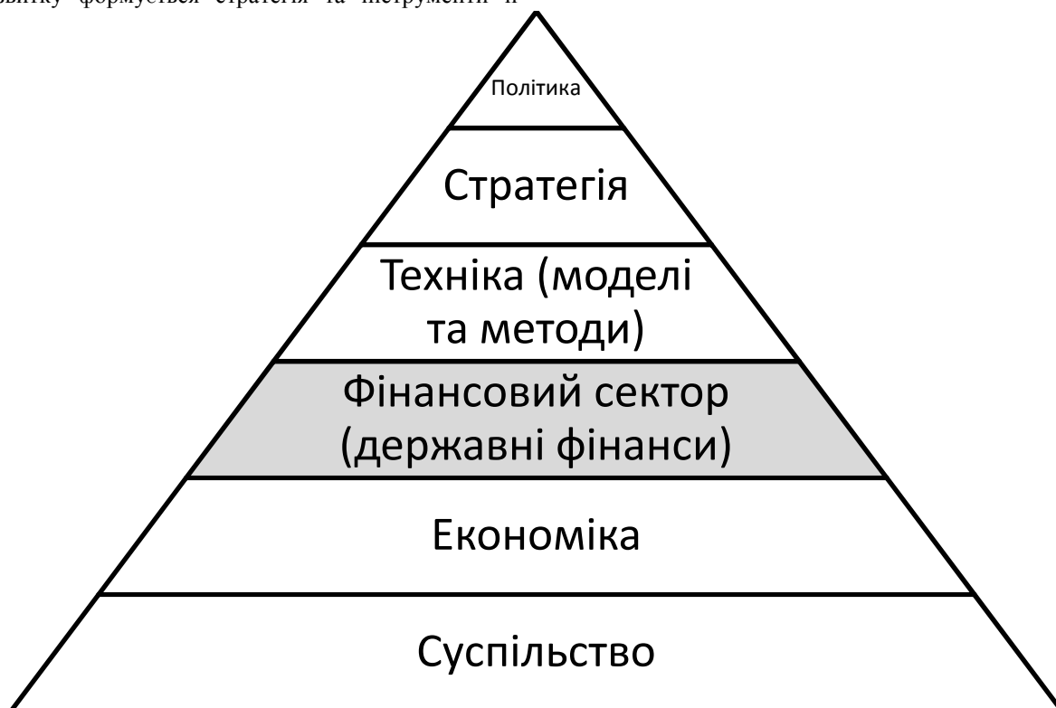
Рис. 2. Узагальнена модель ключових елементів багатовекторної методології управління розвитком фінансового сектору

Управлінський вектор пов'язано із запровадженням “проактивної” моделі середньострокового планування розвитку, яка забезпечить передбачуваність дій у бюджетній сфері. Цей вектор також включає дії, пов'язані з управлінням бюджетом, спрямованим на досягнення соціально значущих результатів та розвиток інструментів фінансового контролю за результативністю та ефективністю діяльності розпорядників бюджетних коштів.