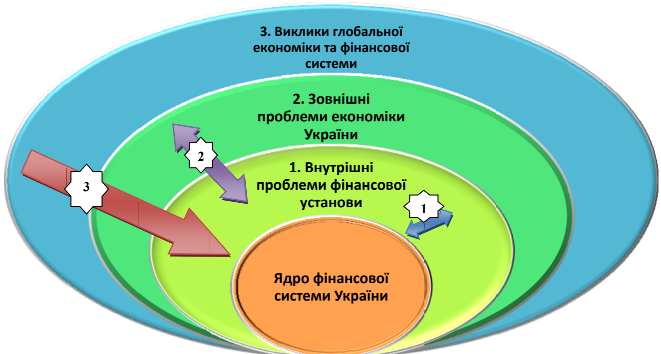
Рис. 1. Концентрична модель управління розвитком фінансової установи на основі трендів