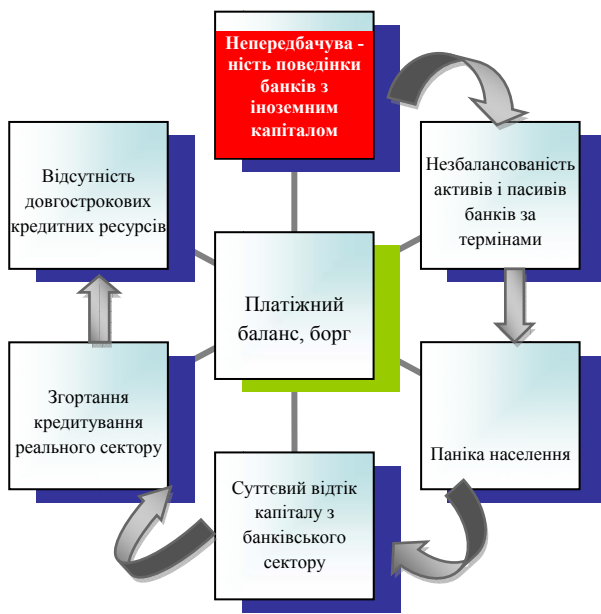
Рис. 4. Ланцюгова реакція, щодо платіжного балансу банків

Подальший сценарій реагування на загрози проникненню залежить від моделі реакції фінансової системи. Приклад моделі сценарію ланцюгової реакції наведено на рис.4.