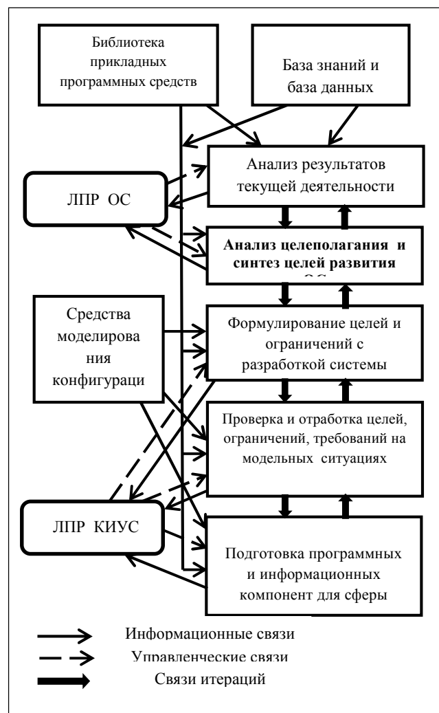
Рис. 2 Обобщенная схема функционирования сферы аналитической модельной конфигурации КИУС

• Отмечена необходимость экспериментальной проверки обобщенной схемы функционирования сферы аналитической системы модельной конфигурации ОС и КИУС с использованием интеллектуальных средств БППС, базы знаний и баз данных.