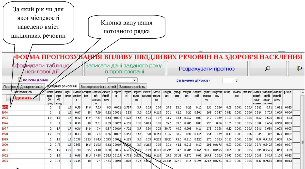
Рис. 2. Форма ведення інформації щодо вмісту шкідливих речовин