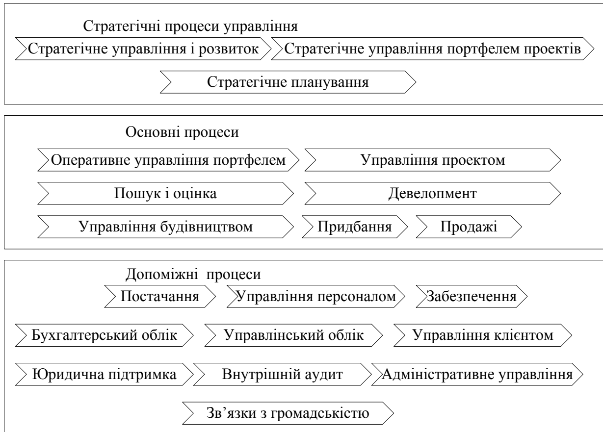
Рис. 3. Схема бізнес-процесів реалізації проектів будівництва об'єктів нерухомості

Бізнес-процес “Девелопмент” включає процеси організації роботи, розробки архітектурної концепції, планування проекту за термінами, доходи і витрати, ризики, містообґрунтування, отримання акту дозволу на використання земельної ділянки.