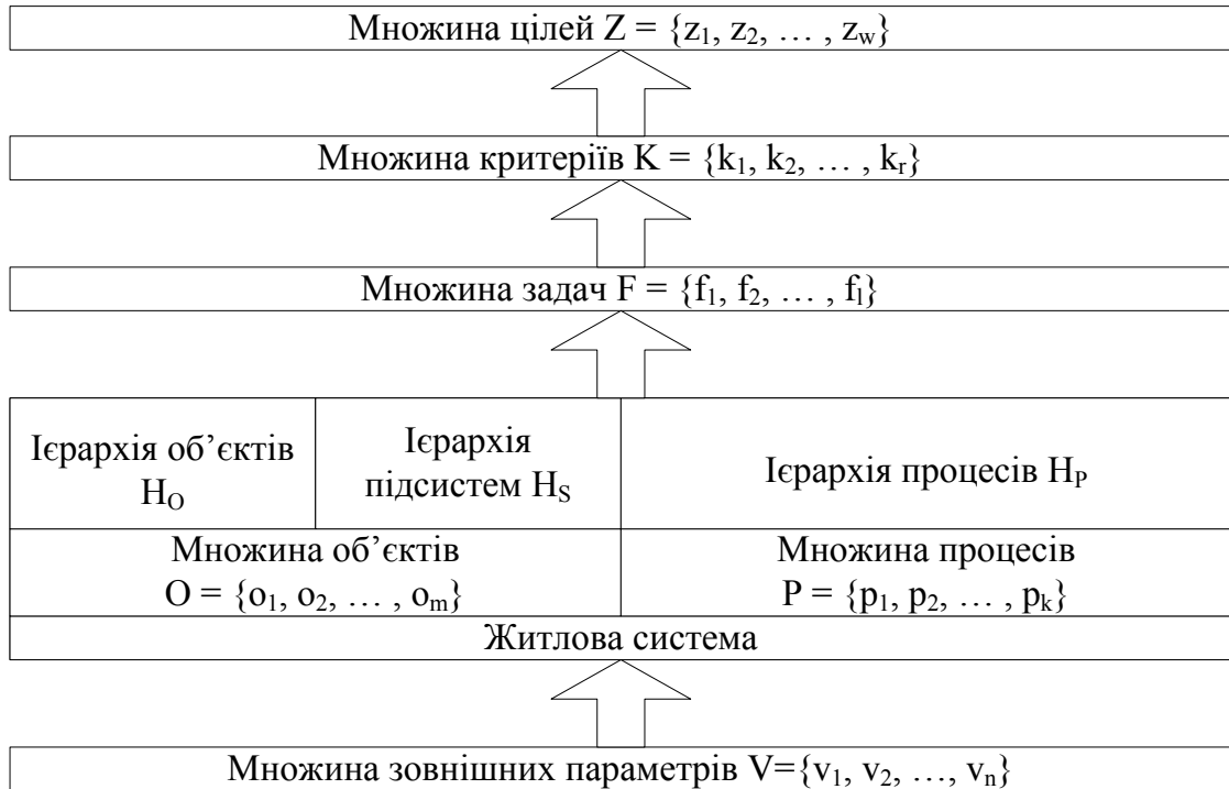
Рис. 1. Структурна схема взаємодії складових житлової системи

Концептуальна модель представляє множину реалізують певні процеси обробки інформації. формальних і логіко-лінгвістичних моделей, які