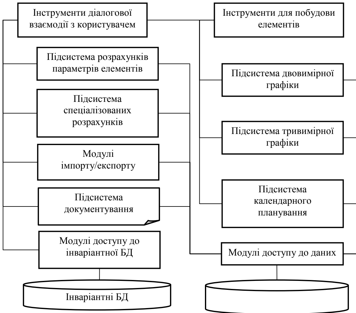
Рис. 3. Узагальнена модель засобів підтримки життєвого циклу будівельних об'єктів

уявного універсального засобу, що забезпечує автоматизацію всього життєвого циклу будівельного об'єкта. Ця модель містить головні складові елементи такого засобу на найвищому рівні декомпозиції.