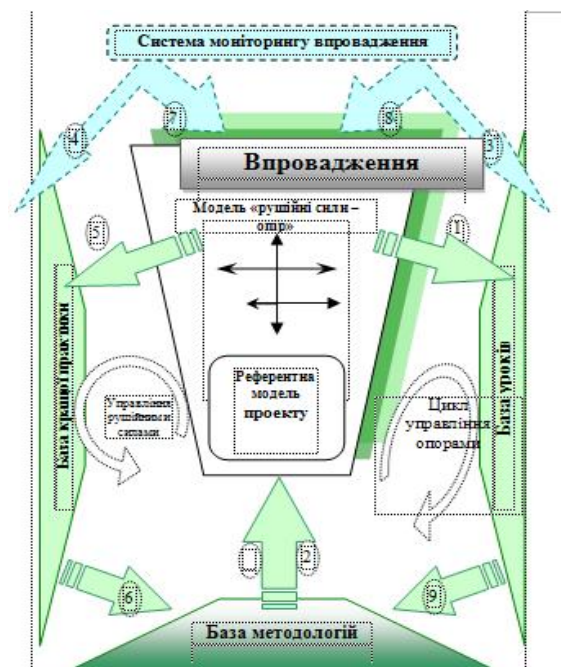
Рис.1. Концептуальна модель успіху проектів системи управління та успіху проектів.

осмислення, формування та моделювання поняття проектної орієнтованості з метою розробки практичних рекомендацій щодо розвитку бізнесу в умовах, коли проектне управління ще не стало основним інструментом бізнесу, але вже потребує особливої уваги керівників організацій. Концептуальна модель управління успіхом впровадження проектів наведена на рис 1. Концептуальна модель побудована на базі управління рушійними силами та опором проектів, має вбудовані механізми накопичення інформації, формалізації уроків та кращої практики проектів для подальшого використання цих знань в якості референтних моделей для оцінювання ефективності