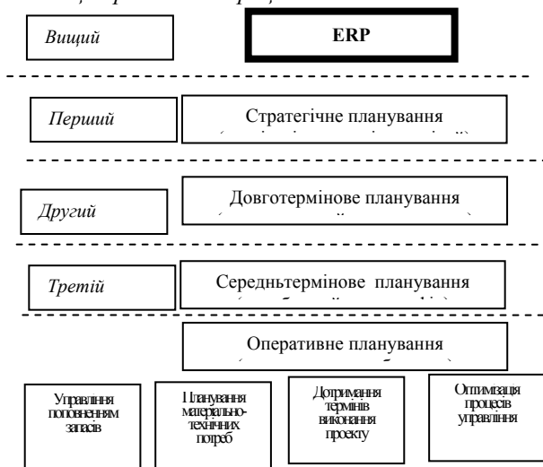
Рис. 2. Рівні інтеграції виробничого планування та управління

Контракти та договори з постачальниками та замовниками повинні документально фіксувати