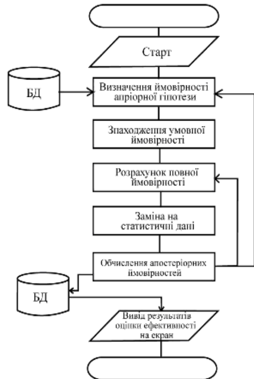
Рис.2. Алгоритм оцінки ефективності рекламних заходів

Значення m_i визначається точно під час спілкування з клієнтом і не потребує ніяких додаткових затрат. Недоліком представленої методики є те, що точне визначення n_i потребує додаткових досліджень і не завжди можливе.